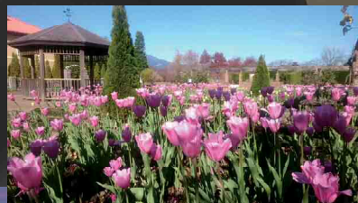
花菜ガーデンチューリップ